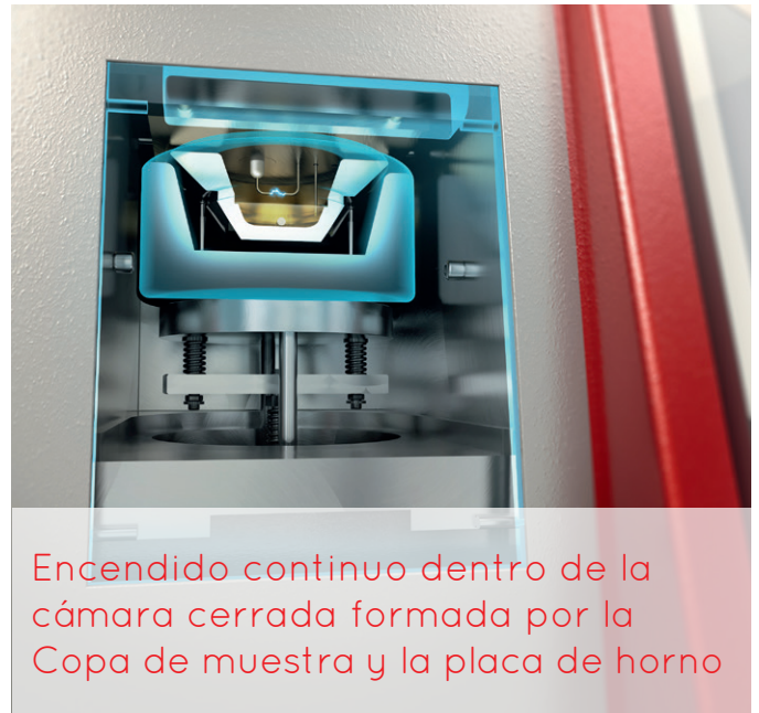
Encendido continuo dentro de la cámara cerrada formada por la Copa de muestra y la placa de horno

ERAFLASH es la solución de prueba de punto de inflamación una amplia variedad de industrias. Se utiliza para especificar los combustibles, analizando aceites lubricantes nuevos y usados, también pruebas de bitumen. El pequeño volumen de muestra también hace que sea ideal para las muestras más caras, tales como sabores y fragancias, cosméticos, pinturas y barnices o incluso residuos peligrosos.