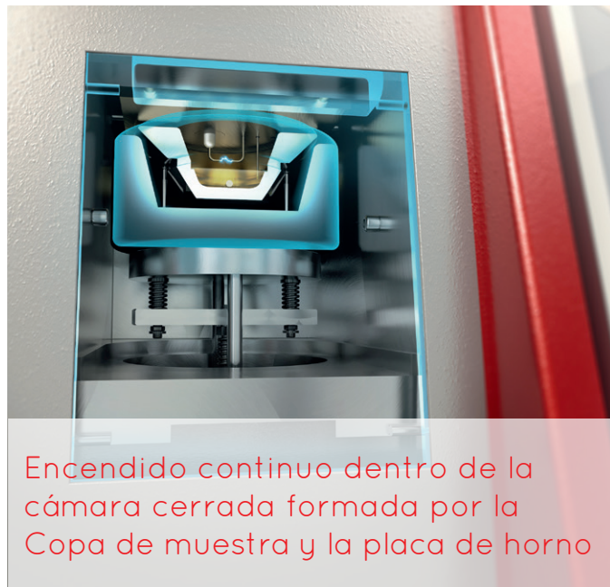
Encendido continuo dentro de la cámara cerrada formada por la Copa de muestra y la placa de horno

ERAFLASH es la solución de prueba de punto de inflamación una amplia variedad de industrias. Se utiliza para especificar los combustibles, analizando aceites lubricantes nuevos y usados, también pruebas de bitumen. El pequeño volumen de muestra también hace que sea ideal para las muestras más caras, tales como sabores y fragancias, cosméticos, pinturas y barnices o incluso residuos peligrosos.